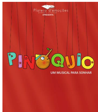
“Pinóquio – Um Musical Para Sonhar”