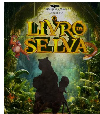
“O Livro da Selva”